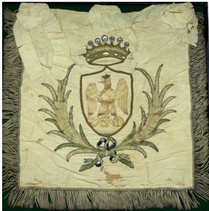
Tablier de trompette huissiers Ville de Nice Anonyme, 1860 ca.

Dès le 1 er avril 1860, des manifestations sont organisées pour l'arrivée des premières troupes impériales françaises. Le 3 avril 1860, le 2 e bataillon de ligne fait son entrée dans Nice sous les acclamations du public. Durant l'après-midi, sur la place Masséna, une foule accompagnée par un orchestre d'harmonie reprend en chœur très symboliquement L'air de la Reine Hortense attribuée à Hortense de Beauharnais. L'air connut un réel succès au XIX e siècle, sous Napoléon Bonaparte bien sûr, mais également pendant la Restauration et le Second Empire, où il devint quasiment un hymne national. Le public suivra, jour après jour, le programme de ces festivités ; lesquelles s'achèveront, en point d'orgue, par la visite à Nice de l'empereur Napoléon III en septembre 1860.