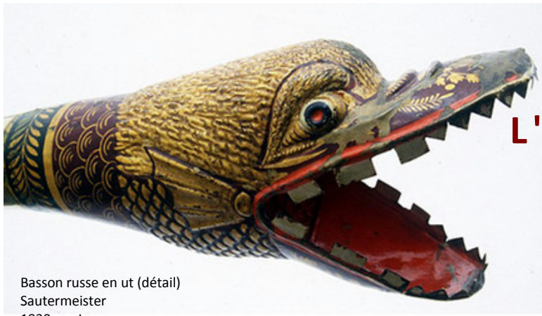
Basson russe en ut (détail) Sautermeister 1830 ca, Lyon Collection instrumentale du Palais Lascaris